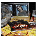
Open Mic POTRVÁ #55 6. 6. 2012 fotografie: 35