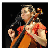
Open Mic POTRVÁ #54 2. 5. 2012 fotografie: 57