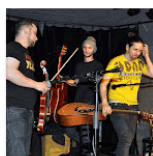
Open Mic POTRVÁ #53 4. 4. 2012 fotografie: 59