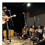
Open Mic POTRVÁ #52 7. 3. 2012 fotografie: 70