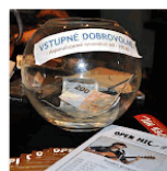
Open Mic POTRVÁ #51 2. 2. 2012 fotografie: 47